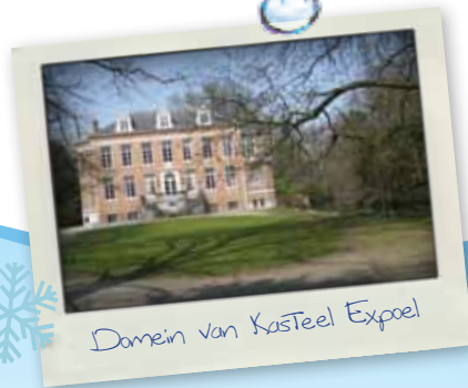
Domein van Kasteel Expoel